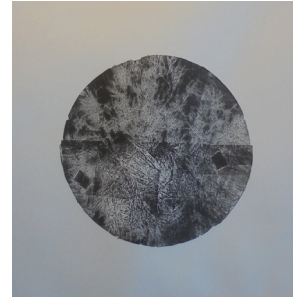
Assunta Abdel Azim Mohamed Phase I, Phase II, Phase III , 2016 Monotypie auf Papier je 80x80cm

Im Rahmen unserer Ausstellung präsentieren wir vier Künstler, die sich mit unterschiedlichsten Techniken und Inhalten dem scheinbaren Gegensatz von Kunst und Industrie widmen und ihren Ideen in ihren malerischen und plastischen Arbeiten Ausdruck verleihen. Die Kontrastierung von Kunst und Industrie soll die formalen Möglichkeiten beider Spannungsfelder aufzeigen und deren Unterschiede, aber auch Schnittstellen verdeutlichen. Dabei steht weniger eine Vorgabe seitens des Unternehmens im Vordergrund, sondern vielmehr wird den Künstlern ermöglicht, nach neuen Wegen des künstlerischen Ausdrucks in der freien Auseinandersetzung zwischen Kunst und Industrie zu suchen.